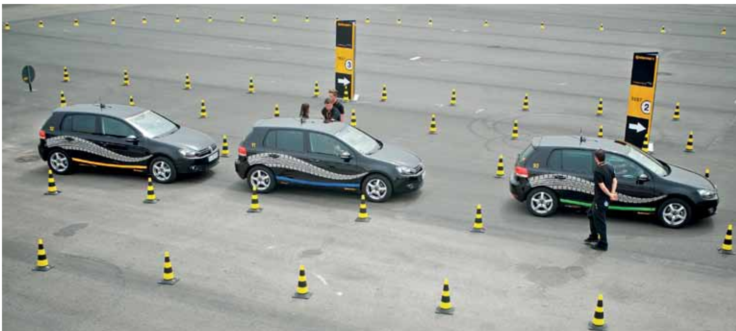
Om het verbruik te vergelijken werd een vloot van 14 identieke Golfjes 1.2 TSI ingeschakeld.

vloeiende lagere verbruik en de geringere CO 2 -uitstoot van groter belang zijn dan je op het eerste gezicht zou denken.